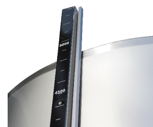
Regleta de nivel

Los depósitos se realizan solamente bajo pedido, lo que nos permite adaptarnos a las necesidades de nuestros clientes.