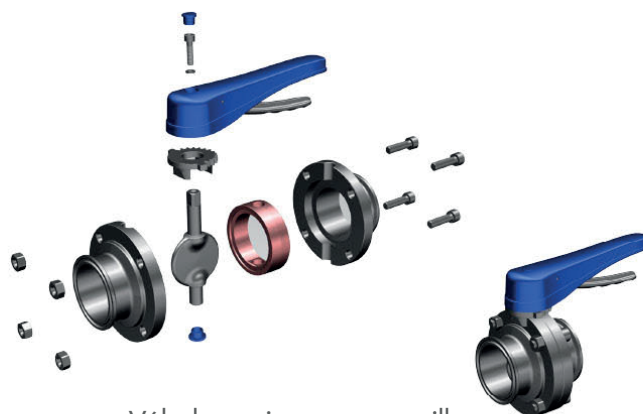
Válvula mariposa con manillar de múltiples posiciones