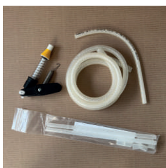
Kit adicional OIL KIT LLENADORA BOTELLAS MOD. VAC 1 CAÑO EMLLVAC30