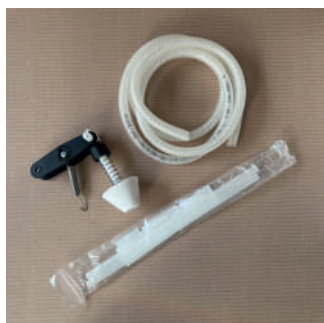
Kit adicional MILK KIT LLENADORA BOTELLAS MOD. VAC 1 CAÑO EMLLVAC41